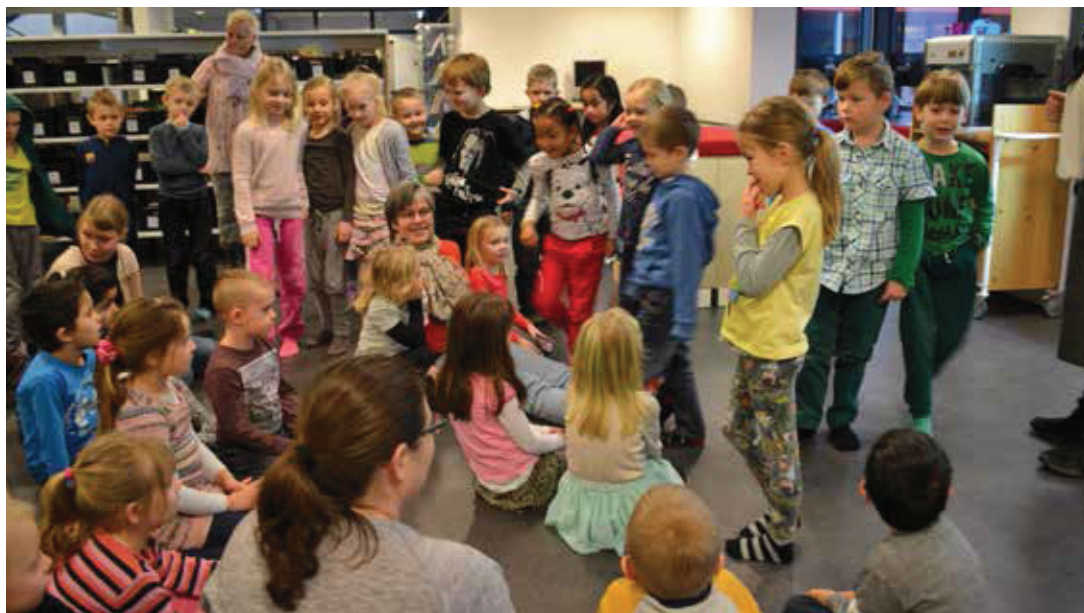
En del af projektet i Frederikssund går ud på at knytte venskaber på tværs af skole og børnehave – og det lykkes.

Som regel overlever de gode, dem kan man ikke bare lade dø. Men skurkene! De har ikke